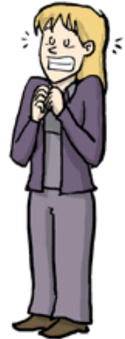
The Assistant Professor

Still doesn't believe just a few months ago they were on the other side just like you. Pretends to be an adult.