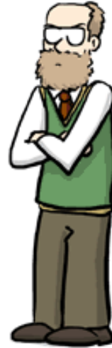
Adversary The Asshole

Only here for the free cookies. Don't forget to bring cookies.